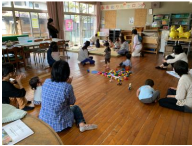
・はじめましてのおしゃべり会