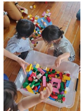
・おかたづけは、みんなで！