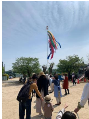
・鯉のぼりをあげよう